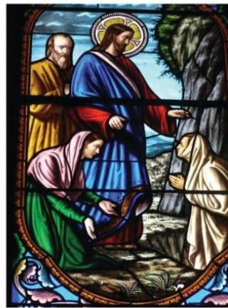
Apparition aux femmes - vitrail, église d'Arthun ©Défrade

BAISER EPINES PRIERE BON LARRON GLOIRE RENIEMENT CAIPHE GOLGOTHA REPAS CALVAIRE JERUSALEM ROMAINS CENE JUDAS ROI CENTURION LINCEUL ROYAUME COURONNE OLIVIERS SIMON PIERRE CRUCIFIXION PAIN SERVITEUR CROIX PARTAGE TOMBEAU CYRENE PASSION TRAHISON DISCIPLES PHARISIENS TRAITRE DON PILATE VETEMENT VIN